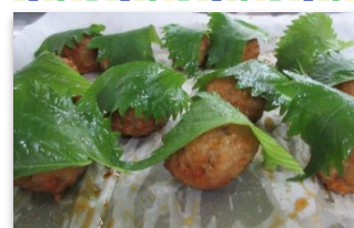
つくねの大葉巻き梅風味

【献立】 おにぎり2種(きのこ・栗) さんまの竜田揚げ さつまいもの天ぷら つくねの大葉巻き梅風味 炊き合わせ(南瓜・蓮根・もみじ麩) かにかま卵焼き 漬物 デザート(りんごのタルト)